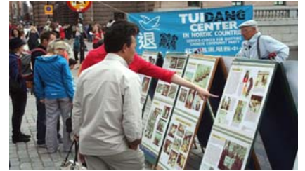
真相展板吸引民众驻足观看

在中国的迫害, 他们在支持制止中共迫害法轮功的征签簿上签下自己的名字, 并对法轮功学员说的最多的就是: “我们能为你们做些什么?” ◇