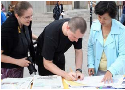
民众签名谴责中共迫害法轮功

瑞典首都斯德哥尔摩的钱币广场(Mynttorg)上, 来自世界各国的游客常是络绎不绝, 当人们看到介绍法轮大法和揭露中共迫害法轮功学员的真相展板时, 都希望能早日终止发生