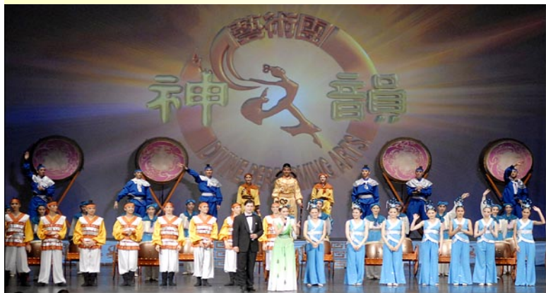
“神韵晚会”美国新泽西州上演 观众盛赞