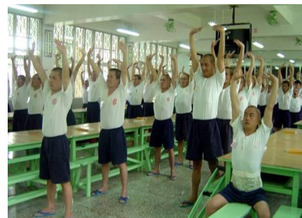
台湾多家监狱把学炼法轮功纳入教化课程。图为服刑人在炼功。

工作中，无论手上有什么大案，我都以平常心来对待，不因案情繁杂而厌烦，思维更缜密，更能耐心听讼。当事人的态度再激动，我依然能保持心平气和，这样有助于案子快速高效的审结。我的身心比以前更健康，法院的同事们也知道了法轮功真的是博大精深的修炼法门。