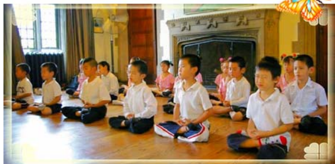
【明慧网】为期六周的多伦多明慧学校夏令营