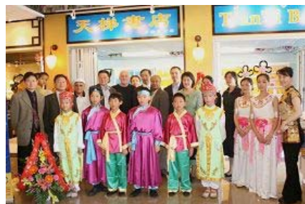
多伦多天梯书店开业典礼

天梯书店的大幅中英文招贴画中的净莲在当街的窗户上向楼下的车水马龙盛开，蓝底金字的大招牌在古色古香的商铺中分外醒目。装饰简约的书店里，一排排明亮洁净的书架上陈列着法轮功创始人李洪志先生的不同语种的系列原著和音像制品。书