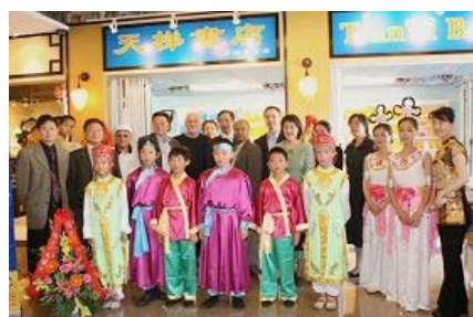
多伦多天梯书店开业典礼

天梯书店的大幅中英文招贴画中的净莲在当街的窗户上向楼下的车水马龙盛开，蓝底金字的大招牌在古色古香的商铺中分外醒目。装饰简约的书店里，一排排明亮洁净的书架上陈列着法轮功创始人李洪志先生的不同语种的系列原著和音像制品。书