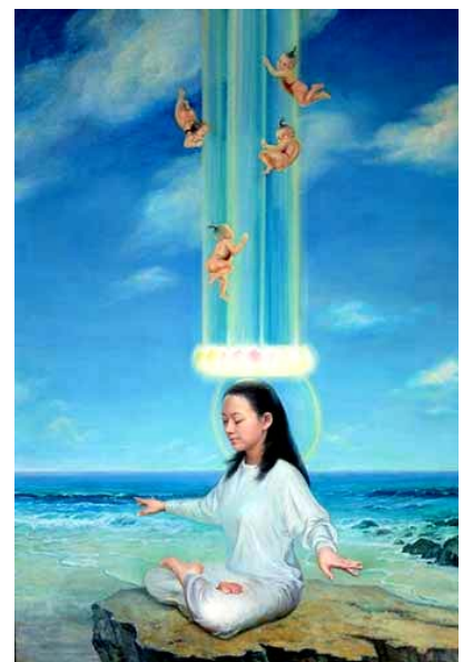
真善忍美展作品：天人合一