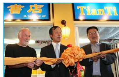
嘉宾为多伦多天梯书店剪彩

八月三十一日，加拿大多伦多最热闹的中区唐人街，新开张了一家非同一般的书店：天梯书店——法轮功书籍的专营店！这是在北美的又一家天梯书店。