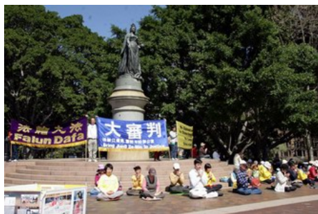
澳洲纽省高等法院前女皇广场

【明慧网】二零零八年九月十五日，澳洲法轮功学员状告迫害法轮功元凶江泽民、罗干及 610 办公室一案在纽省高等法院开庭。