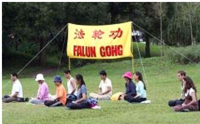
法轮功学员炼第五套功法

【明慧网】二零零八年八月十日，当看到在瑞典斯德哥尔摩著名的旅游景点瓦萨沉船博物馆（Vasa museet）旁集体炼功的法轮功学员时，一对来自中国大陆的老年夫妇感叹道：“真的是哪里都有法轮功啊！”