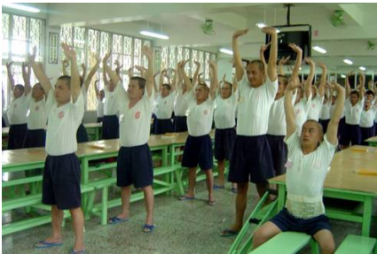
台湾多家监狱把学炼法轮功纳入教化课程。图为服刑人在炼功。

底曝光，就如纳粹大屠杀被曝光一样。她说：“不管人们是在国际大赦还是类似的部门工作，这事就如当初在德国发生的纳粹大屠杀案一样，因为它太恐怖了以至人们不敢相信。因为太可怕，每个人都假装这事不存在。不过这事终将被曝光，就象当初纳粹的罪行被曝光一样。但不幸的是，又如当初纳粹德国被允许举办奥运一样，这次中国（中共暴政）也被允许举办奥运，并以此掩盖其罪恶。我认为中共犯下的是反人类罪，这（迫害）让我心碎。”