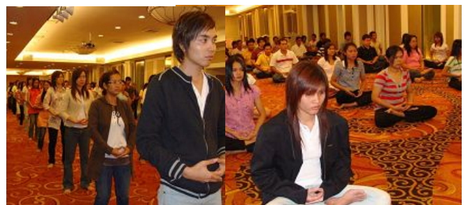
曼谷 SAKURA 公司全体上百名员工集体炼功

【明慧网二零零八年九月三日】二零零八年八月三十一日下午，泰国曼谷 SAKURA 公司全体上百名员工聚集在湄南酒店（MENAM HOTEL）举办了一场法轮功专题讲座。在近三个小时的讲座中，泰国法轮功学员向该公司员工介绍法轮大法洪传世界的盛况，同时揭露仍然在中国发生着的中共对法轮功的邪恶迫害及活摘器官等真相。员工们明白真相后纷纷表示对法轮功的同情和支持，并认真学习五套功法。很多人当场感受到大法纯正、祥和、美妙的超常能量。