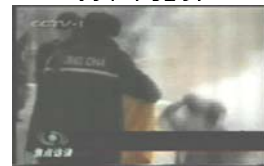
3、手摸被打后的头部