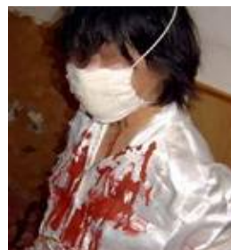
酷刑演示 戴芥末油口罩

上这种酷刑，邪党恶警一般选在半夜夜深人静的时候。他们先是把大法学员抓来后，锁进特制的铁椅子内，手反铐在背后，脚分别扣在两个半环扣在一起的圈里，双脚固定在一个位置不能动，在特制的地环内，全身动弹不得。恶警一般白天审讯的时候，威胁、恐吓、诱供，看问不出结果，就开始谩骂，一边谩骂一边说：“看我怎么收拾你”。然后派一个人或两个人专门看管大法学员，不让睡觉，不让闭眼。恶警们一般前半夜睡觉，半夜睡醒后，恶警们象地狱中的魔鬼一样，突然闯进来，然