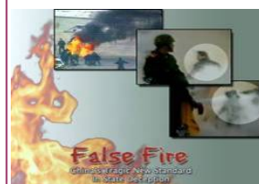
揭露自焚的影片《伪火》获第51届哥伦布国际电影节荣誉奖。