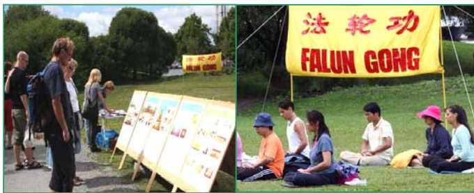
左图：来自世界各地的游客在展板前了解真相，然后到旁边签上自己的名字，表示支持法轮功、呼吁制止中共的迫害。右图：瑞典法轮功学员炼第五套功法。

【明慧网】二零零八年八月十日，在瑞典斯德哥尔摩著名的旅游景点瓦萨沉船博物馆旁，当看到集体炼功的法轮功学员时，一对来自中国大陆的老夫妇感叹道：“真的是哪里都有法轮功啊！”