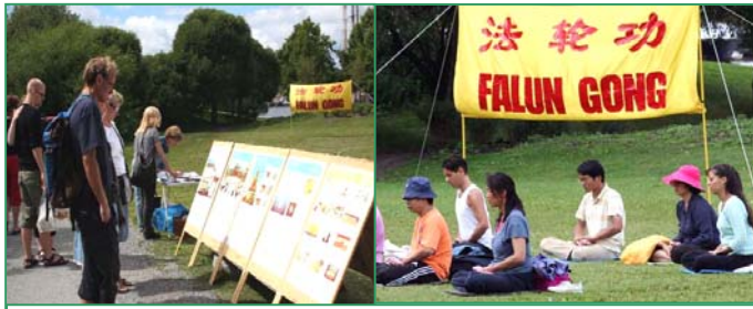
左图：来自世界各地的游客在展板前了解真相，然后到旁边签上自己的名字，表示支持法轮功、呼吁制止中共的迫害。右图：瑞典法轮功学员炼第五套功法。

【明慧网】二零零八年八月十日，在瑞典斯德哥尔摩著名的旅游景点瓦萨沉船博物馆旁，当看到集体炼功的法轮功学员时，一对来自中国大陆的老夫妇感叹道：“真的是哪里都有法轮功啊！”