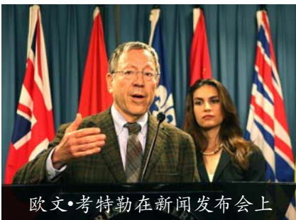
欧文·考特勒在新闻发布会上

其中法轮功学员受迫害的分析单独列出，考特勒说，“法轮功是被迫害的，而且是比其他任何团体受到的迫害都要更加惨烈。联合国专员的报告也说明了这点。”◇