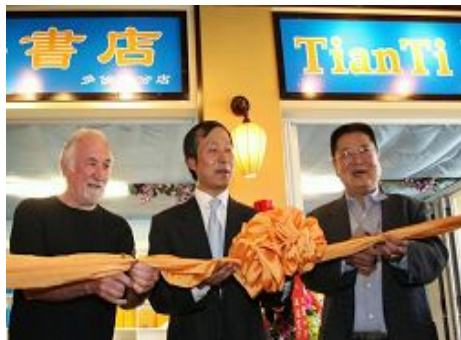
嘉宾为天梯书店多伦多分店开业剪彩

(明慧记者叶灵辉多伦多报道) 二零零八年八月三十一日, 天梯书店多伦多分店在加拿大多伦多市中国城登打士西街四百二十一号罗湖商城二楼举行开业庆典。多伦多法轮