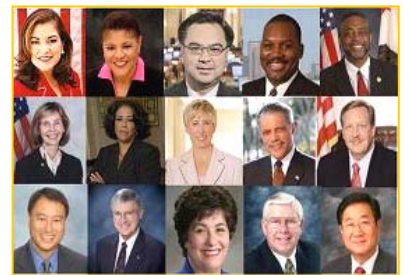
■ 美国加州各级政要纷纷为神韵晚会颁发褒奖

法轮大法如今洪传八十多个国家和地区，信众一亿多人，在中共的残忍打压下越来越声势浩大，且法轮功学员不畏艰险，广传真相，救度世人，这不正印证着佛经上的记载吗？