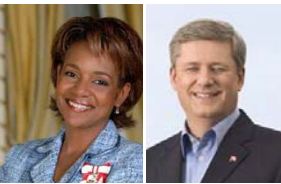
■ 加拿大总督米希尔·庄(右)和总理史蒂芬·哈珀为神韵晚会发来贺信。