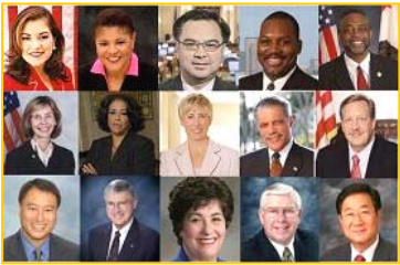
■ 美国各级政要纷纷为神韵晚会颁发褒奖，上图为颁发褒奖的加州政要照片。

此年轻而对古典舞的理解和表达力却如此深刻，他们做的都非常完美！非常完美！这和他们平时学习文化的刻苦精神是非常分不开的，他们一定是很多的努力才能达到这种境界的，真不容易。编导很有创造力，舞蹈布局非常好，自创的音乐独具一格，充分表达了中国古典舞的精华，这确实是少有的，非常精彩，非常精彩！”