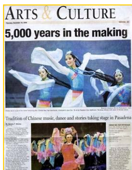
■ 美国《帕萨迪纳星报》大篇幅介绍神韵晚会。

神韵艺术团的成员都是海外修炼法轮功的艺术家，他们以纯善纯美的歌舞、中西合璧的音乐、动感三维天幕呈现给观众世界顶级的艺术盛宴。晚会以中国古典舞为主，通过庄严殊胜的神佛、降妖除魔的孙悟空、贤淑英勇的花木兰、尊贵吉祥的凤凰仙子、济世救人的济公和尚……诠释了中华五千年文化的精髓，深