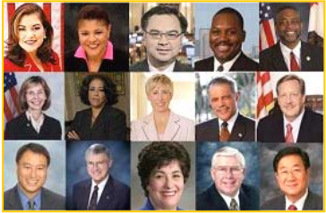
■ 美国各级政要纷纷为神韵晚会颁发褒奖，上图为颁发褒奖的加州政要照片。