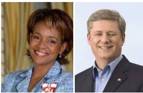
■ 加拿大总督米希尔·庄(右)和总理史蒂芬·哈珀为神韵晚会发来贺信。