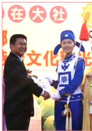
乡长向天国乐团的代表颁赠感谢状

编者注： 法轮大法已洪传世界八十多个国家和地区，受到世界人民的赞叹和尊敬。法轮大法因为对人类身心健康的杰出贡献，获得世界各国政府的两千多项褒奖。九九年七月中共迫害法轮功后，通过法轮功学员坚持不懈的讲真相，越来越多的人从中共导演的“自焚”、“围攻”等谎言中看清了中共的邪恶，也见证了法轮功的纯正美好。仅台湾一地，修炼人数已从迫害之初的几千人，增至现在的约五十万。◇