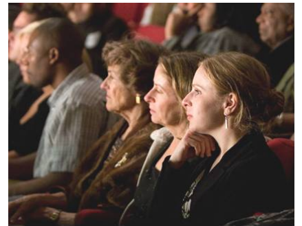
■ 观众凝神欣赏神韵表演

演出的最后一个节目是《了解真相是得救的希望》，许多观众看过演出后表示，感受到了希望。诗人戴毕丁（下）说：“歌曲的歌词写得非常高贵，歌词是为一个更高层次境界的人类本性而创作的，这些超越的价值