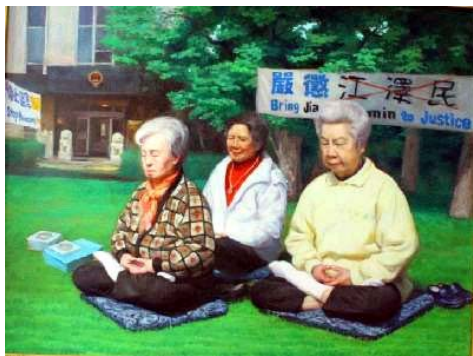
■绘画：几位年过七旬的老年大法弟子长期坚持在中领馆前炼功请愿

看到大法弟子们和一些正义律师等人所言所行，自己真觉得惭愧，简直枉为须眉。以前认为人活着，起码在大陆专制体制活着，就应该忍辱偷生，就不能说真话，不能说心里话。但是大法弟子的惊世之举，在告诉我，人活着不仅要为肚皮，还要为真理，为追求，为信仰！（文／段云章）◇