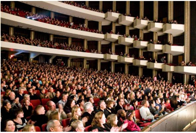
■ 观神韵，渥太华国家艺术中心座无虚席

二零零九年一月四日下午，美国神韵纽约艺术团在加拿大渥太华国家艺术中心的演出在满场观众们的敬慕、感恩的目光和雷鸣般掌声中落幕。三天四场的演出场场爆满，八千六百余名现场观众在精美绝伦的艺术享受的同时，也从不同角度和层次感受晚会所传达的内涵，对美好事物的渴望、对神传文化的向往、对现实生活的反思，以及对人生真谛和生命意义的思考。