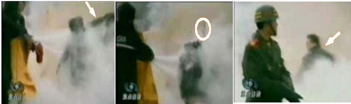
1.刘头部受重击 2.击打后飞出 3.打击者仍保持的重物 用力姿势

公元二零零一年一月二十三日, 中共江泽民导演的“自焚” 闹剧, 通过新华社以从未有过的速度向全世界散播, 嫁祸法轮功。在电视、广播、报纸铺天盖地的喧嚣中, 声情并茂的揭批中, 要刻意煽动的是人们对法轮功的仇恨敌视。