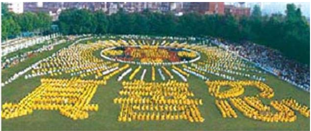
湖北省武汉市，5000 多法轮功学员集体炼功组成“法轮图形”和“真善忍” ---1997

我看了《九评共产党》之后，才彻底明白了这个道理，真正明白了为什么要远离中共，退党、退团、退队（三退）觉醒。如果大多数人都能对中共大声说“不”，一定会引来全世界的关注，中共便不敢恣意妄为。如果更多的人都能通读《九评共产党》，看清共产党的本来面目，清除中共的毒素，并广泛传播，让无数人三退觉醒，中共就没有立锥之地，就会顷刻解体。天灭中共的历史洪流正在轰轰烈烈的展开，已经有 4800 多万勇士退出中共各级组织，所有的中国人都应当清醒起来，不要再受