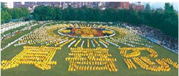
湖北省武汉市，5000 多法轮功学员集体炼功组成“法轮图形”和“真善忍” ---1997

一九九五年一月法轮功主要著作《转法轮》由中国广播电视出版社出版发行，同年一月四日在北京公安大学礼堂举行了《转法轮》首发式。《转法轮》自出版后一直供不应求，一九九六年一月被《北京青年报》评为北京市十大畅销书。