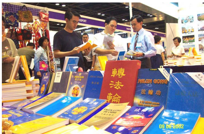
新加坡世界书展中的各语种法轮功书籍。 (2002 年 6 月)