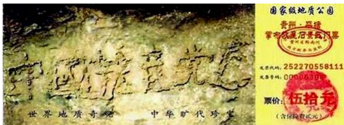
图为藏字石风景区门票：“中国共产党亡”清晰可见

贵州省平塘县掌布乡风景区内有一“藏字石”。经专家鉴定，500年前有一块距今2亿7千万年的巨石从崖壁落下，落地一分为二。2002年6月，石头断面被当地人发现有一行汉字，这些汉字经三批国内专家鉴定，其结论为天然形成。而石头上清晰