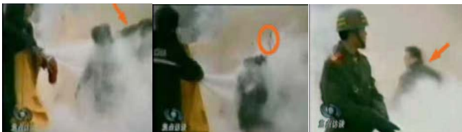
1.刘头部受重击 2.击打后飞出的重物 3.打击者仍保持用力姿势

美国华盛顿邮报记者菲力蒲·潘 (Phillip Pan) 亲自到刘春玲的家乡开封实地调查，邻居们说从来没有人看见过刘春玲练法轮功，而且刘春玲不是开封本地人，生前在夜总会靠陪舞谋生。