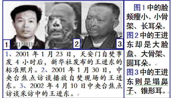
图1中的脸颊瘦小、小骨架、长耳朵。图2中的王进东却是大脸盘、大骨架、圆耳朵。图3中的王进东则是塌鼻子、锥形耳。

1、2001年1月23日，天安门自焚事发4小时后，新华社发布的王进东的标准照片。2、2001年1月30日，中央台焦点访谈播放自焚现场的王进东。3、2002年4月10日中央台焦点访谈采访中的王进东。