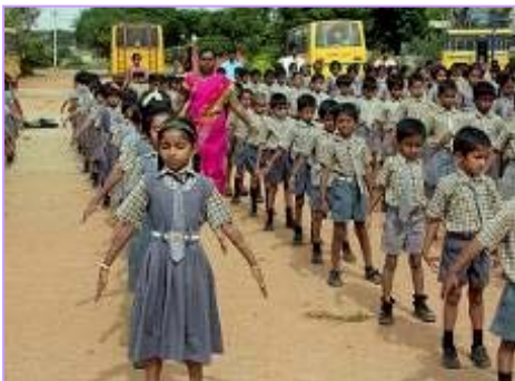
右图：学校学生集体炼法轮功。