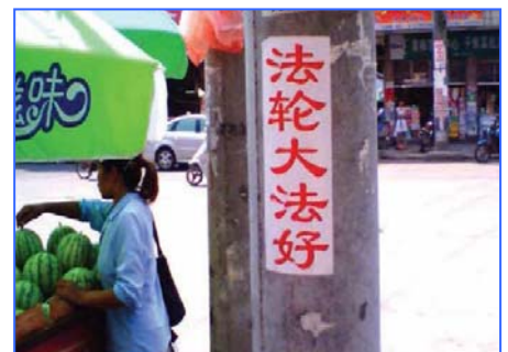
街头标语：法轮大法好

现在越来越多的正义律师们站出来为法轮功学员做无罪辩护，而迫害法轮功学员的元凶江泽民已经在十八个国家和地区被起诉，罪行是群体灭绝罪、酷刑罪、反人类罪。