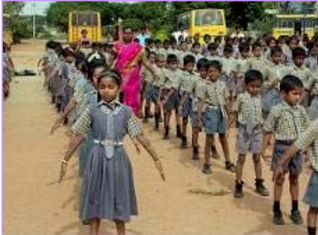
右图：学校学生集体炼法轮功。