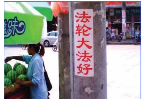
街头标语：法轮大法好

现在越来越多的正义律师们站出来为法轮功学员做无罪辩护，而迫害法轮功学员的元凶江泽民已经在十八个国家和地区被起诉，罪行是群体灭绝罪、酷刑罪、反人类罪。