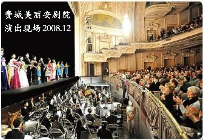
费城美丽安剧院 演出现场 2008.12

下图：神韵晚会12月30日光临洛杉矶，加州各级政要纷纷为神韵颁发褒奖。众议员戴维斯和普雷斯联名发出第一零六号决议，赞赏神韵晚会为世界做出的宝贵贡献。