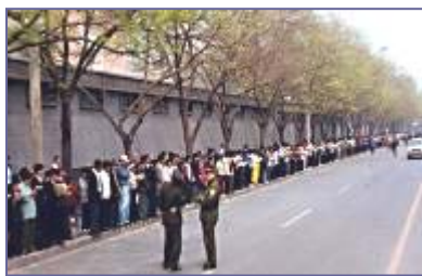
法轮功学员文明安静，警察不用维持秩序，在一旁聊天。学员背后不是中南海红墙，所谓的“围攻中南海”根本不存在。

出于对政府的信任，法轮功学员4月25日自发来到国务院信访办。当日，在国务院总理的直接关注下，合