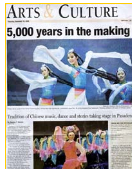
美国《帕萨迪纳星报》大篇幅介绍神韵晚会。

神韵艺术团的艺术家们都修炼法轮功, 他们以纯善纯美的歌舞、中西合璧的音乐、动感三维天幕呈现给观众世界顶级的艺术盛宴。晚会以中国古典舞为主, 通过庄严殊胜的神佛、降妖除魔的孙悟空、