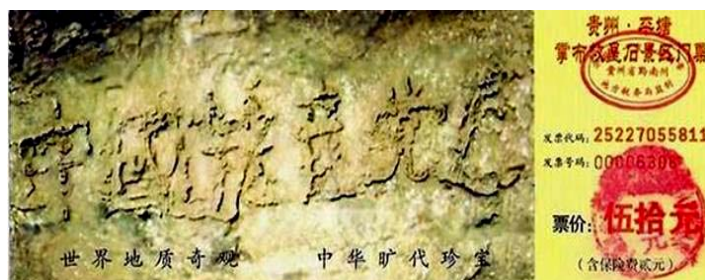
贵州省平塘县掌布乡风景区门票上藏字石的照片

2004 年底《大纪元时报》发表系列社论《九评共产党》，彻底揭露中共的邪恶本质，引发全球华人退党大潮。越来越多的民众看清了中共“假、恶、斗”的真面目，到 2009 年 1 月 19 日已有超过 4853 万中国民众在海外大纪元网站声明退出中共党、团、队。为自己选择了光明的未来。其中包括中共党政军高层内的党员。