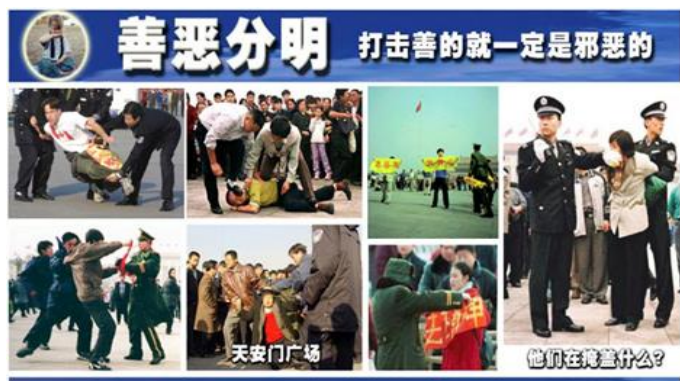
上图为一九九九年七月二十日至今，中共对国内外法轮功学员到天安门上访时的残酷镇压，略举一、二。

一九九九年七月起，中共与江氏集团在大陆残酷迫害法轮功学员，迄今已造成至少三千二百二十三名法轮功学员死亡，无计其数的法轮功学员被非法劳教、关押、判刑，被迫害致伤残、失学、失业、流离失所、家破人亡。