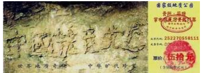
图为藏字石风景区门票：“中国共产党亡”清晰可见

历史上秦朝灭亡前也曾经发现一石头上有“灭秦者胡”几个字。秦始皇以为“胡”是指北方的匈奴，就不停的修筑长城加强防范。然而却没有料到灭秦者正是他自己的儿子——胡亥。可见天意不可违也。