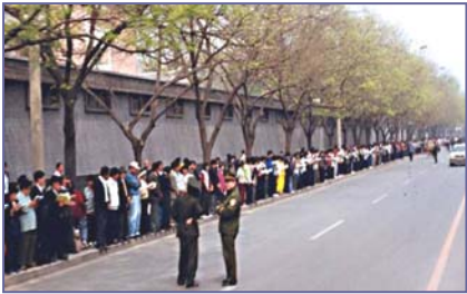
法轮功学员文明安静，警察不用维持秩序，在一旁聊天。学员背后不是中南海红墙，所谓的“围攻中南海”根本不存在。

出于对政府的信任，法轮功学员4月25日自发来到国务院信访办。当日，在国务院总理的直接关注下，合理解决了天津暴力抓人事件。晚上学员们散去时，地上一片纸屑都没有，连警察扔的烟头都给捡起来了。法轮功学员所表现出的和平理性和对正信与公义的坚守，得到了国际社会的高度评价，被称作“中国上访史上规模最大、最理性平和、最圆满的上访”。 4·25当晚，江泽民出于妒忌，强行推翻政府总理的开明决定，把和平上访歪曲成“围攻中南海”，并于99年7月开始全面迫害法轮功。