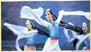
Tradition of Chinese music, dance and stories taking stage in Pasadena