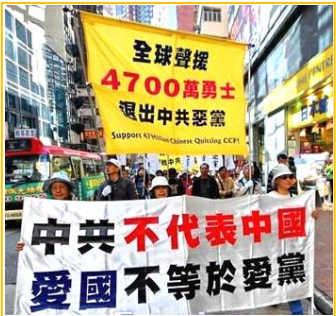
《九评共产党》深刻揭露了中共的邪恶本质，已在大陆掀起 4800 万人退党大潮。图为 2009 年元旦香港民众声援退党大游行。

那么谁是中国的食品污染的罪魁祸首？其实食品污染的严重程度就是共产党造成的。有人会说全世界都有污染问题。是的，但有哪一个国