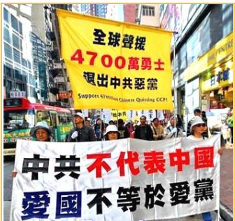
《九评共产党》深刻揭露了中共的邪恶本质，已在大陆掀起 4800 万人退党大潮。图为 2009 年元旦香港民众声援退党大游行。

那么谁是中国的食品污染的罪魁祸首？其实食品污染的严重程度就是共产党造成的。有人会说全世界都有污染问题。是的，但有哪一个国