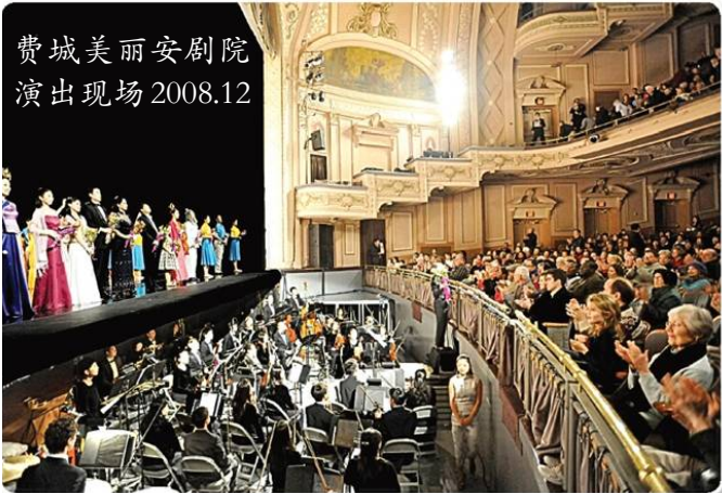
费城美丽安剧院 演出现场 2008.12

下图：神韵晚会 12 月 30 日光临洛杉矶，加州各级政要纷纷为神韵颁发褒奖。众议员戴维斯和普雷斯联名发出第一零六号决议，赞赏神韵晚会为世界做出的宝贵贡献。