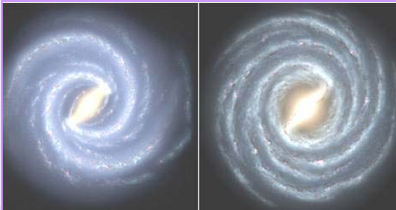
左：银河系的目前结构 右：较早的银河系图像

一儆百的恐怖主义手法。人们看到法轮功学员被抓、被打、被开除、被活摘器官，内心深处的恐惧让人不敢向往“真善忍了”，中共彻底堵死了人们回归善良的路。