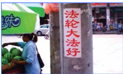
街头标语：法轮大法好

答：既然法轮功好为什么就不能光明正大出来炼，而要躲在家里偷着炼呢？一个心底无私的人为什么不能向自己的同胞、政府堂堂正正地讲真话？“慈父遭谤子不在，世人都会骂不仁。”作为深深受益于法轮大法的人，在我们