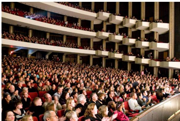
■ 观神韵，渥太华国家艺术中心座无虚席

二零零九年一月四日下午，美国神韵纽约艺术团在加拿大渥太华国家艺术中心的演出在满场观众们的敬慕、感恩的目光和雷鸣般掌声中落幕。三天四场的演出场场爆满，八千六百余名现场观众在精美绝伦的艺术享受的同时，也从不同角度和层次感受晚会所传达的内涵，对美好事物的渴望、对神传文化的向往、对现实生活的反思，以及对人生真谛和生命意义的思考。