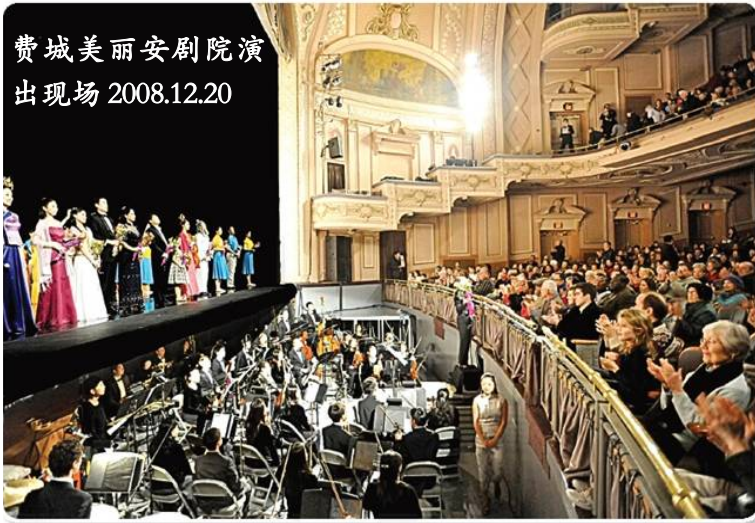
费城美丽安剧院演出 出现场 2008.12.20