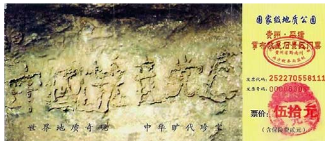
贵州省平塘县掌布乡 风景区门票

2002年6月，在贵州省平塘县掌布乡风景区发现了距今2.7亿岁的“藏字石”，巨石断面惊