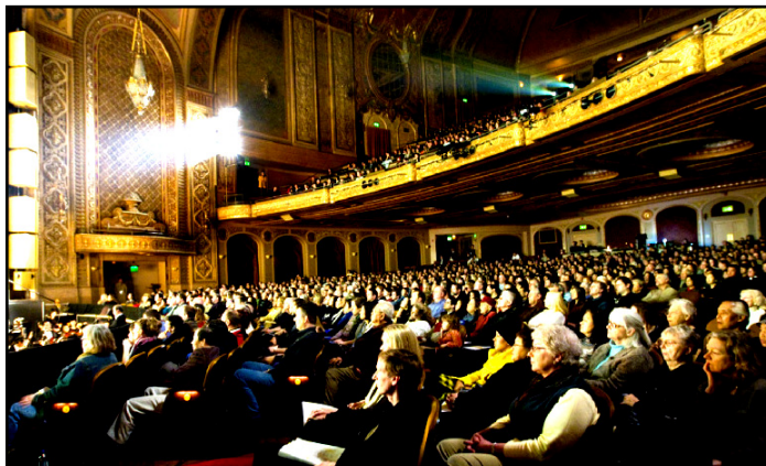
09 年 1 月 18 日于西雅图派拉蒙剧院的演出满场