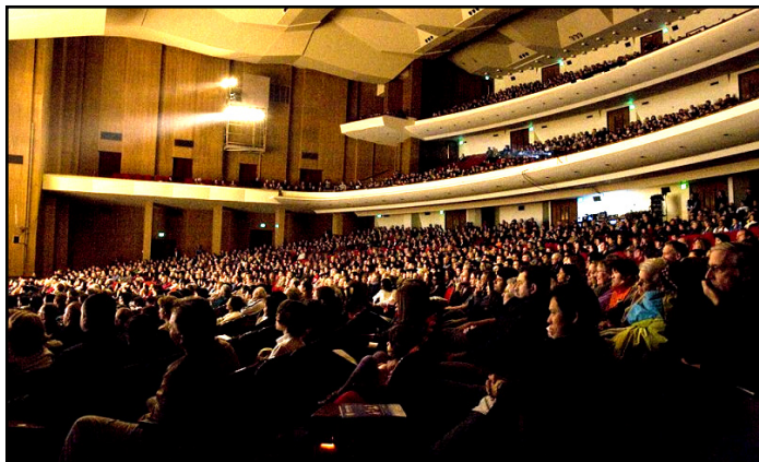
2009 年 1 月 20 日美国波特兰的首次演出满场