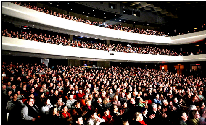
09 年 1 月 17 日在蒙特利尔第 3 场演出座无虚席

就像寒冬中的暖流，给人们带来温馨和希望。曾做过近四千个演出剧评的美国著名百老汇音乐剧评论家 Richard Connama 评价神韵是“五星级演出”。自腊月二十八(周五)开始，在大纽约地区四个著名剧院上演 12 场晚会，数万名现场华人和各族裔观众将与神韵艺术家们一起辞旧迎新。