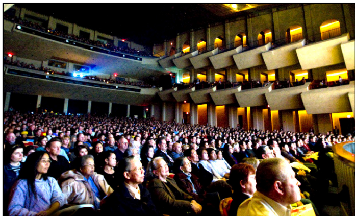
09 年 1 月 15 日在旧金山湾区库柏蒂诺演出满场