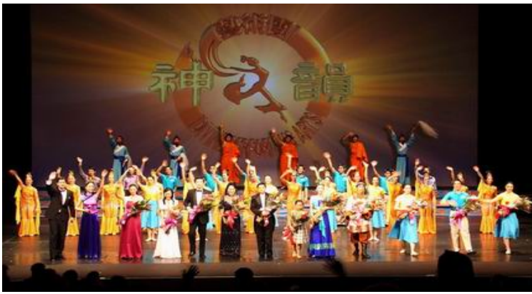
■ 神韵纽约艺术团在多伦多会展中心向热情的观众致意