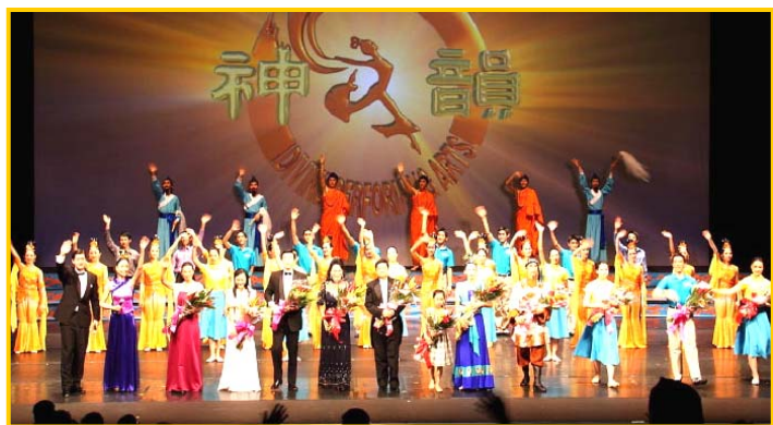
■ 神韵纽约艺术团在多伦多会展中心向热情的观众致意