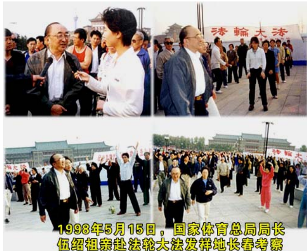
1998 年 5 月 15 日，国家体育总局局长伍绍祖