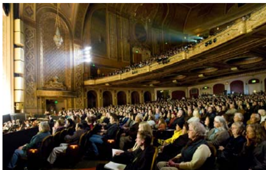
美国西雅图现场观众

“神韵、神韵哪，我一直不知道神韵含义在哪儿，现在开始理解了，她的‘韵’就是‘真、善、忍’，这个韵是谁能够感受到，谁就能跟着神一起回家。”◇