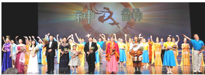
09 神韵世界巡演 三大艺术团 两大乐队现场伴奏 巡回 80 多个城市 300 场演出 观众将超过百万

神韵晚会是以中国古典舞为主，包括民间舞、民族舞和独唱、独奏的大型歌舞晚会。晚会以绚丽的古典服装、逼真的三维动态天幕、技巧高难的中国古典舞、中西合璧的乐队、震撼心灵的演唱，组合成世界顶级的视听盛宴。