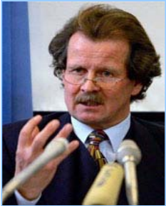
联合国“酷刑问题”特派专员诺瓦克教授曾多次向联合国酷刑委员会提出法轮功学员被活摘器官的指证

【明慧网】零八年十一月二十一日，联合国要求中共立即组成独立调查团，对法轮功学员受到酷刑虐待甚至被活摘器官的指控进行调查，并要求对参与迫害的责任人绳之以法。这是全世界最大的国际组织近几年来第一次直接命令中共政权对其大范围的迫害人权负责。十一月七日，联合国反酷刑委员会的专家对中国执行《禁止酷刑公约》的情况进行质询。在发现作为缔约国的中国未能履行公约中的条款后，反酷刑委员会二十一日命令中共对法轮功学员器官被活摘的指控和对这场对法轮功迫害的责任人进行调查。委员会还要求中共对“劳教”制度、国家机密法律、骚扰辩护律师、骚扰和酷刑对待人权捍卫者和原告人、缺少调查以及资料