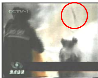
2、击打后飞出的重物