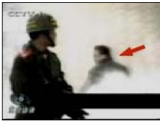
4、击打者仍保持用力姿势