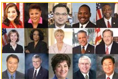
美国加州各级政要纷纷为神韵晚会颁发褒奖