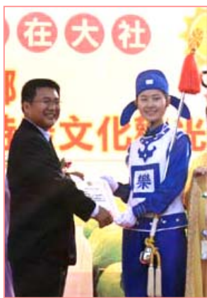
乡长向天国乐团的代表颁赠感谢状

编者注： 法轮大法已洪传世界八十多个国家和地区，受到世界人民的赞叹和尊敬。法轮大法因为对人类身心健康的杰出贡献，获得世界各国政府的两千多项褒奖。九九年七月中共迫害法轮功后，通过法轮功学员坚持不懈的讲真相，越来越多的人从中共导演的“自焚”、“围攻”等谎言中看清了中共的邪恶，也见证了法轮功的纯正美好。仅台湾一地，修炼人数已从迫害之初的几千人，增至现在的约五十万。◇