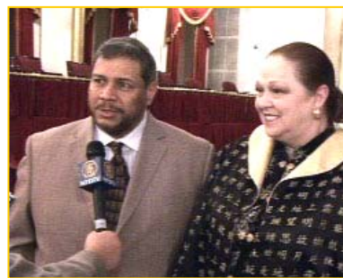
派腊西欧先生经常从中国进口产品。他说神韵表演让他看到了不曾在中国看过的文化。

派腊西欧先生说，他最喜欢《济公抢亲》的节目。济公云游四海，济世救人。他看到村民即将遭灭顶之灾，