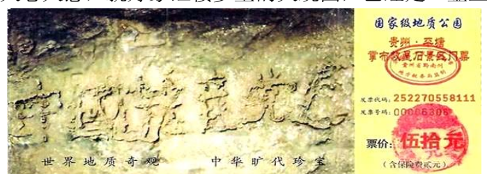
贵州省平塘县掌布乡风景区门票

2002 年贵州省平塘县掌布乡发现了迄今已有两亿七千万年的“藏字石”，惊现“中国共产党亡”六