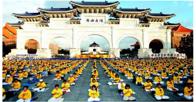
二零零八年十一月四日，三千多名台湾法轮功学员在台北自由广场前炼功，抗议中共迫害法轮功。

而法轮功则相反，没有政治纲领、没有政治目标，没有组织形式，想炼就炼，不想炼就不炼。要求弟子崇尚佛法，内心自省，按“真善忍”的要求去修行，在健身的同时提高道德修养，心灵升华，与人为善，珍爱生命、不杀生（“天安门自焚”事件是新闻造假，漏洞很多，早已成为国际社会的笑谈了。）等等。