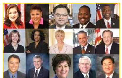
美国加州各级政要纷纷为神韵晚会颁发褒奖