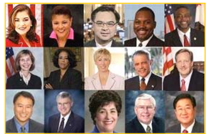
美国加州各级政要纷纷为神韵晚会颁发褒奖

术家组成的神韵艺术团将在美国西部的圣地亚哥等八城市演出三十五场，当地各级政要纷纷颁发褒奖，感谢神韵艺术团为复兴纯正的中华文化付出的努力。