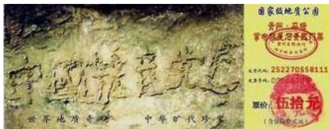
图为藏字石风景区门票：“中国共产党亡”清晰可见

历史上秦朝灭亡前也曾经发现一石头上有“灭秦者胡”几个字。秦始皇以为“胡”是指北方的匈奴，就不停的修筑长城加强防范。然而却没有料到灭秦者正是他自己的儿子——胡亥。可见天意不可违也。