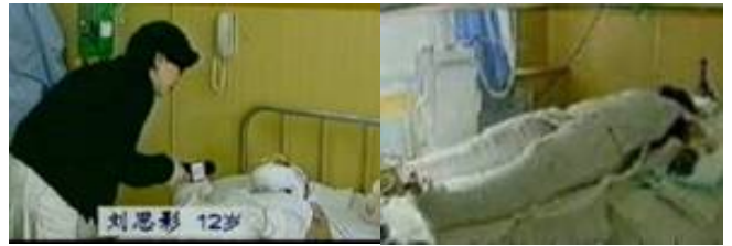
气管切开还能说唱？记者采访不穿防护服不戴口罩。央视《焦点访谈》中“自焚者”被包裹得严密。

人们都觉得奇怪，有人认为是临死前的回病。当时家人就领他去医院全面检查，结果各项指标都正常！大家无不无法轮大法的神奇而感叹、折服！