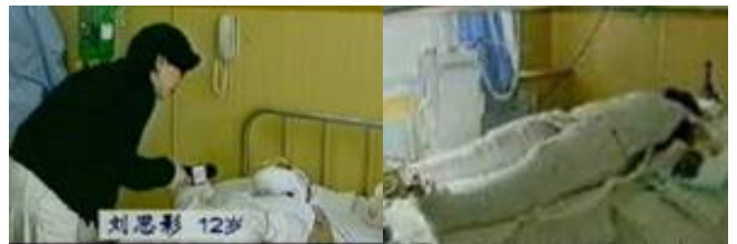
气管切开还能说唱？记者采访不穿防护服不戴口罩。央视《焦点访谈》中“自焚者”被包裹得严密。

人们都觉得奇怪，有人认为是临死前的回病。当时家人就领他去医院全面检查，结果各项指标都正常！大家无不无法轮大法的神奇而感叹、折服！