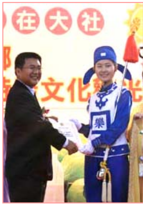
乡长向天国乐团的代表颁赠感谢状

编者注： 法轮大法已洪传世界八十多个国家和地区，受到世界人民的赞叹和尊敬。法轮大法因为对人类身心健康的杰出贡献，获得世界各国政府的两千多项褒奖。九九年七月中共迫害法轮功后，通过法轮功学员坚持不懈的讲真相，越来越多的人从中共导演的“自焚”、“围攻”等谎言中看清了中共的邪恶，也见证了法轮功的纯正美好。仅台湾一地，修炼人数已从迫害之初的几千人，增至现在的约五十万。◇