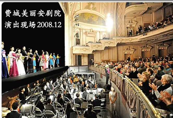
费城美丽安剧院 演出现场 2008.12

下图：神韵晚会 12 月 30 日光临洛杉矶，加州各级政要纷纷为神韵颁发褒奖。众议员戴维斯和普雷斯联名发出第一零六号决议，赞赏神韵晚会为世界做出的宝贵贡献。