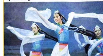
Tradition of Chinese music, dance and stories taking stage in Pasadena