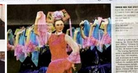
▲ 《帕萨迪纳星报》 长篇介绍神韵晚会