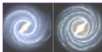
左：银河系的目前结构