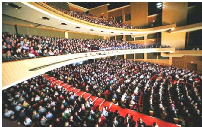
神韵展现真理 震撼美西著名城市圣地亚哥观众