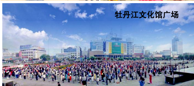
牡丹江文化馆广场