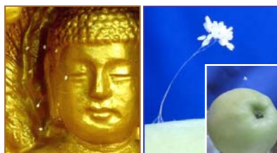
左：韩国须弥山禅院佛像上的婆罗花。