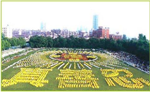
1997年武汉五千多法轮功学员炼功， 排组法轮图形和“真善忍”字样

1999年7月20日，中共发动了对法轮功的全面迫害，引发全球法轮功学员反迫害、讲真相活动。◇