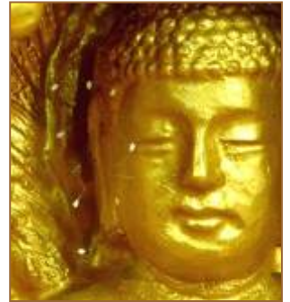
上图：美国纽约，苹果上的优昙婆罗花。